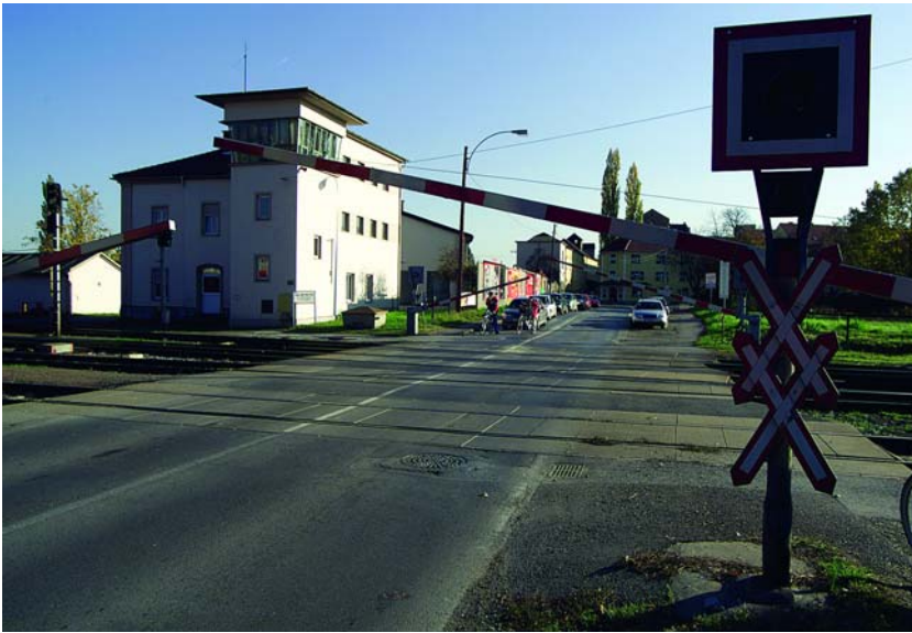
Das Warten vor dem geschlossenen Bahnschranken in der Alten Poststraße soll bald ein Ende haben: Ab 2005 ist hier eine Unterführung der stauträchtigen Bahnkreuzung geplant.