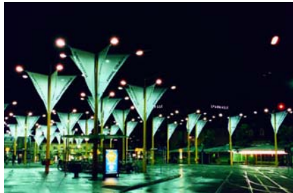
Max Auffischer's „Empörungssiegel“ sorgten im Jahr 1997 auf dem Jakominiplatz für Aufsehen.

häusern und Galerien gezeigt wurden. Jungen KünstlerInnen wurde durch „KultRent“ 600 Projekte ermöglicht, der Carl