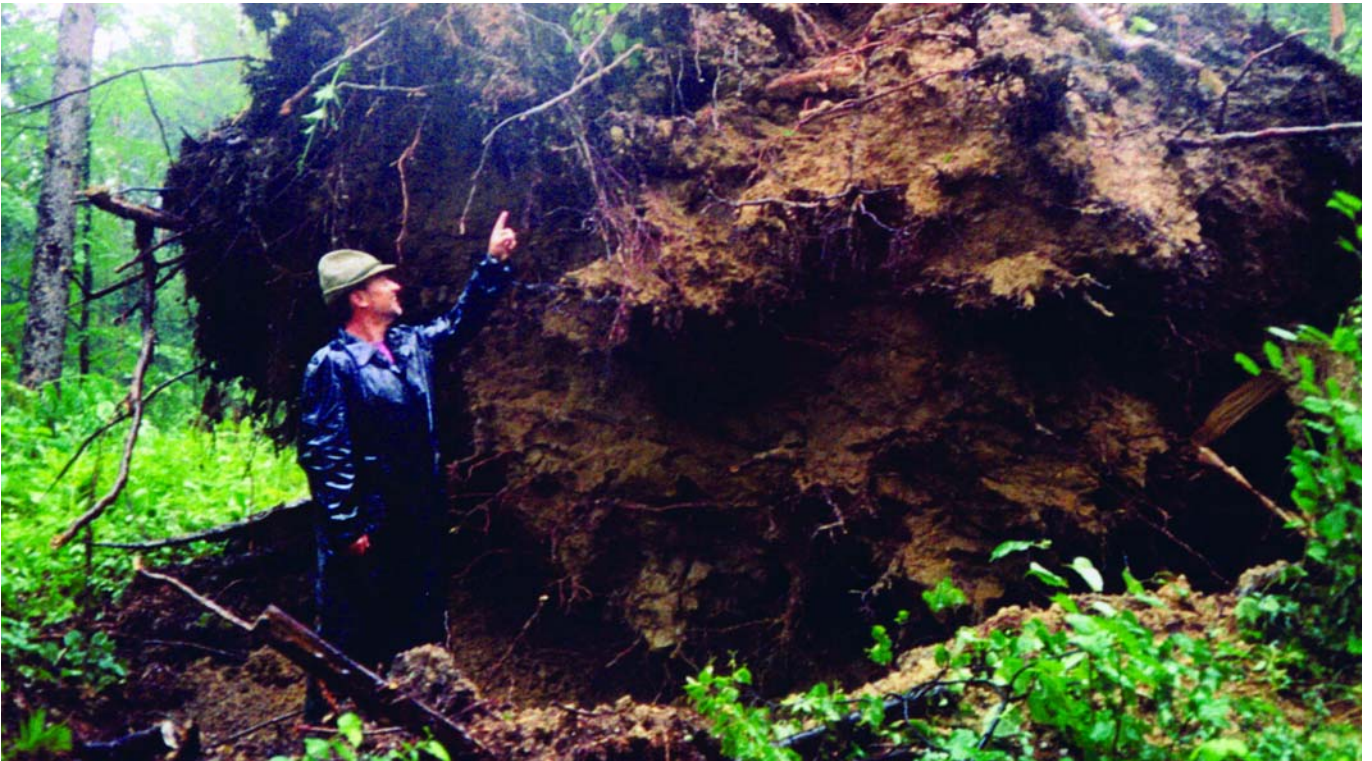
Der Anfang vom Neustart: Ein gigantischer Windwurf, der 1998 auch Baumrisen dieser Größe entwurzelte, führte zum Nachdenken über einen neuen Plan zur Waldpflege, der als langfristiges Projekt in Graz umgesetzt wird.