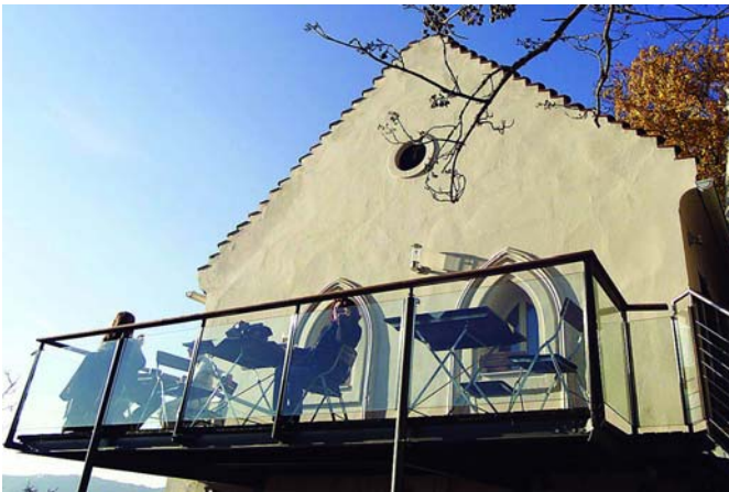
Klein, aber fein: Für Feiern im intimeren Rahmen ist das entzückende Starcke-Häuschen ein Top-Adresse auf dem Schloßberg.

und ein unvergleichbares Ambiente. Buchen kann man diese Kasematten in der städtischen Liegenschaftsverwaltung unter Telefon 0 31 6/872-45 10, 45 11 oder 45 12. Die große Kasemattenbühne oder der „Dom im Berg“, der schon einige legendäre Clubbings „gesehen“ hat, werden