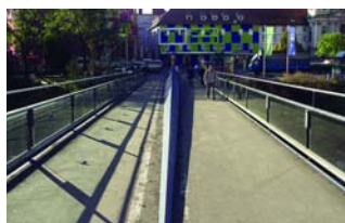
Der Mursteg zwischen Lend und Innerer Stadt heißt nun Erich-Edegger-Steg.