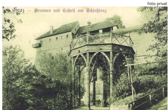
Der Türkenbrunnen in einer alten Ansicht.

Bergleute und Hilfspersonal errichteten 1554-1558 einen 88 m tiefen Schacht. Jahrzehnte später mußte der Brunnen auf 94 m verlängert werden. Erst im historistisch gesinnten 19. Jh. erhielt der „Tiefe Brunnen“ den Namen „Türkenbrunnen“. Schöpf-