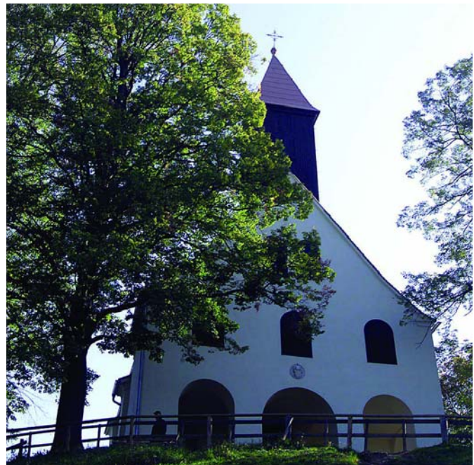
Das malerische Kirchlein von St. Johann und Paul ist einer jener markanten Punkte, um den das sanft genutzte Naherholungsgebiet Plabutsch wachsen soll.

dieser etwa 100 Meter lange Kinderschilift, der rund 35.000 Euro kostet, ist kein brutaler Eingriff in die Natur: Ist der Schnee geschmolzen, wird das Gelände wieder landwirtschaftlich genutzt – dann grasen friedlich wie eh und je