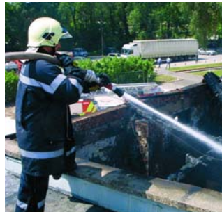
Zu Einsätzen im Grazer Süden werden die Feuerwehrmänner künftig eine kürzere Anfahrt haben.

zial- und Ruheräume und einen Helikopter-Landeplatz umfassen. ■