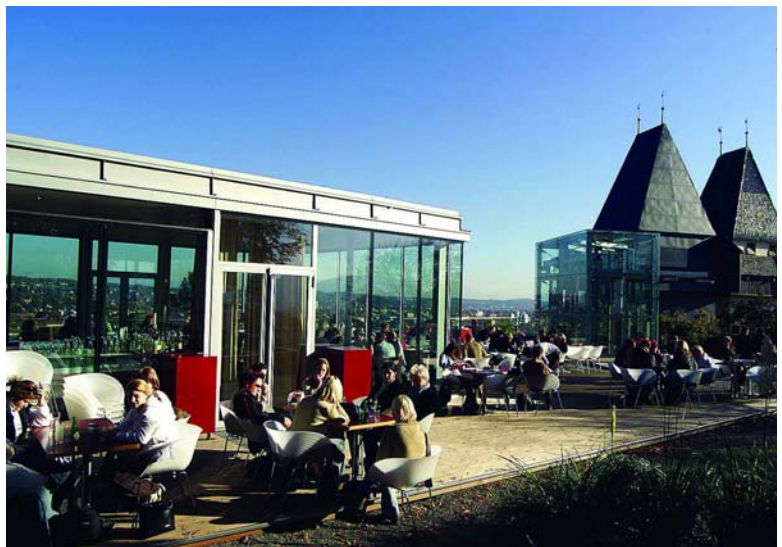
Einer der schönsten Aussichtspunkte auf die Stadt gleich neben dem Uhrturm und dessen Schatten befindet sich auf der Terrasse des neu eröffneten Lokals „Aiola“.

Exklusive Veranstaltungsmö- glichkeiten gibt es aber nicht