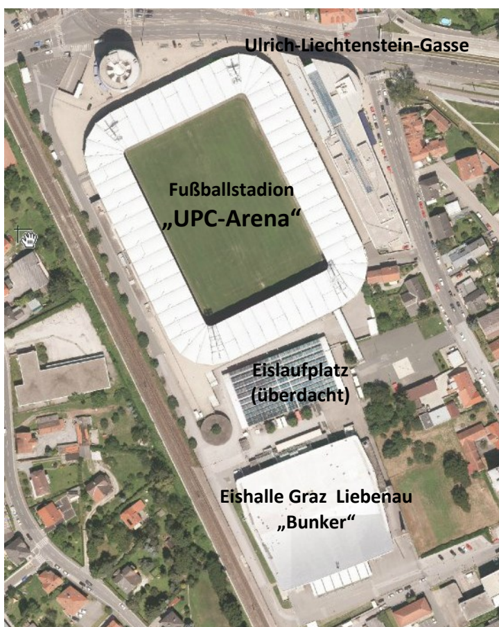
Luftbild – Eishalle Graz Liebenau, überdachter Eislaufplatz und UPC-Arena

Die folgende Abbildung zeigt eine Luftbildaufnahme der von den geplanten Sanierungs- und Umbaumaßnahmen betroffenen Sportstättenstandorte im Bezirk Liebenau.