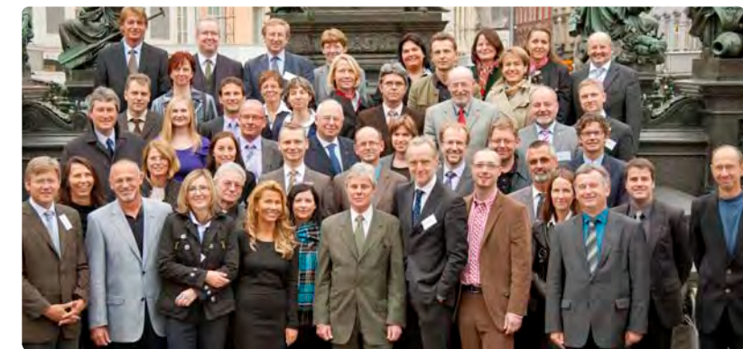
RepräsentantInnen der Kontrollämter und Rechnungshöfe.

Das Grazer LED-Ampelanlagenprojekt wurde mit dem Umweltschutzpreis des Landes Steiermark ausgezeichnet. Der Betrieb der Ampeln mit LED-Lampen bringt nicht nur eine Stromersparnis von mehr als 70 Prozent, sondern auch wesentlich intensiveres Licht, was die Verkehrssicherheit stark erhöht. Pro Jahr können durch den Einsatz der LED-Lampen mehr als 460 Tonnen CO 2 und Kosten von rund 62.000 Euro eingespart werden!