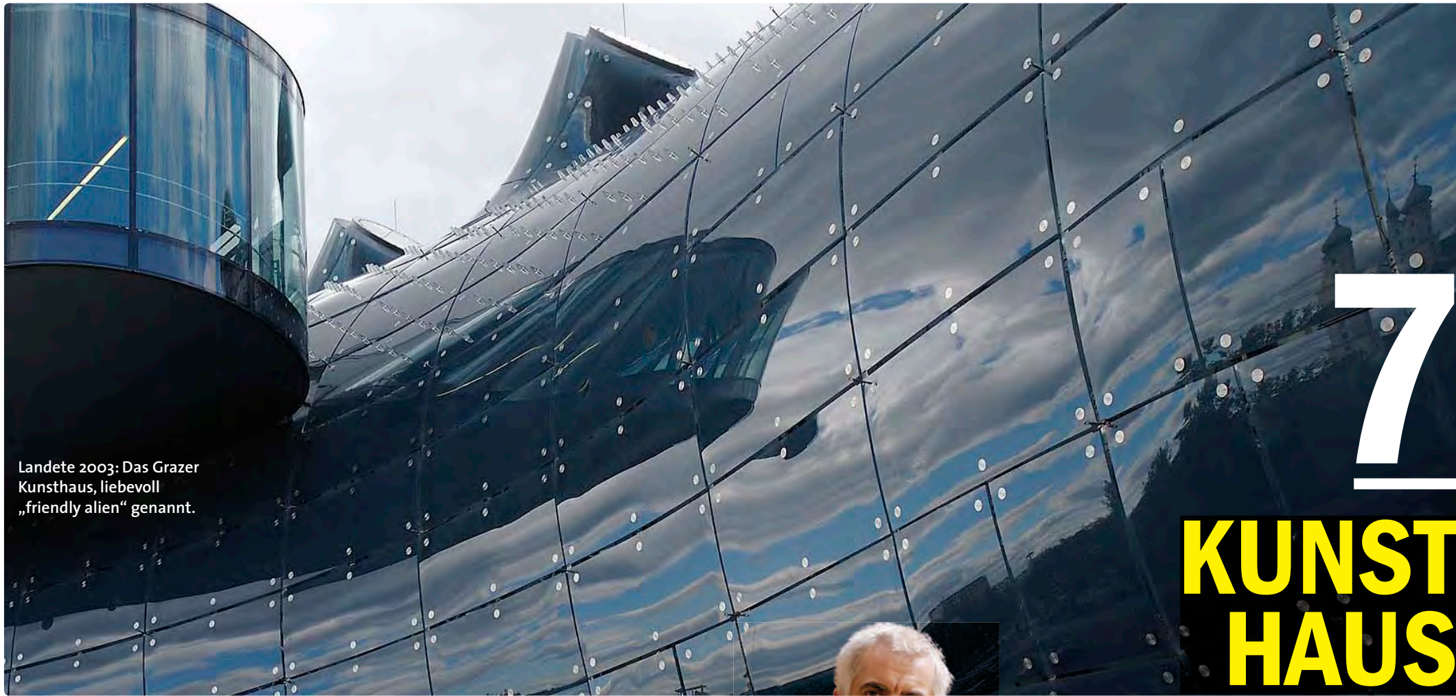
Landete 2003: Das Grazer Kunsthaus, liebevoll „friendly alien“ genannt.