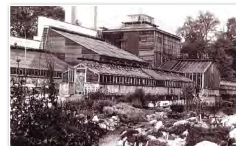
Das nun gefährdete alte Gewächshaus (1889) der Universität in der Schubertstraße.

nicht übereinstimmen: Die Universität kann stolz sein, dass sechs ihrer Lehrer mit dem Nobelpreis ausgezeichnet wurden (Fritz Pregl, Julius Wagner-Jauregg, Erwin Schrödinger, Otto Loewi, Viktor Hess, Karl v. Frisch). Weniger schmeichelhaft ist, dass Hess, Schrödinger und Loewi 1938 die Universität aus unterschiedlichen Gründen verlassen mussten. Auch die Zeit als Deutsche Reichsuniversität war in einzelnen Bereichen kein Ruhmesblatt. Haben sich auch die Zeiten und das Selbstverständnis der Studenten im Laufe der letzten Jahrzehnte grundlegend verändert, sind doch viele Traditionen geblieben. Noch ziehen die akademischen Würdenträger in ihren Amtstrachten ein, noch gibt es