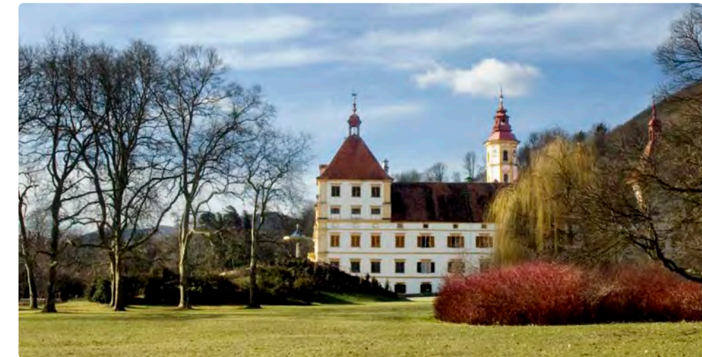
Schöne Ansichten! Das Schloss Eggenberg steht im Mittelpunkt des Interesses.

www.graz.at/unesco www.museum-joanneum.at www.unesco.at www.urbact.eu/hero