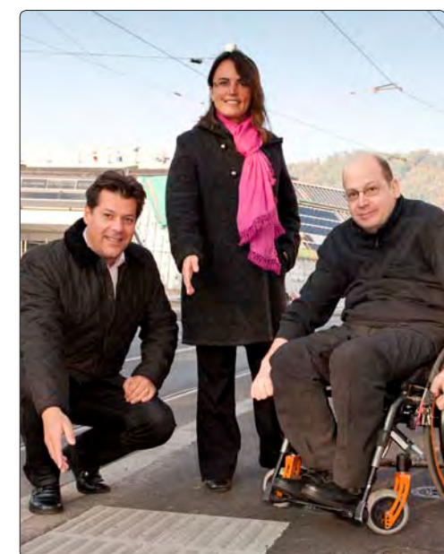
Barrieren-Abbau beim neuen Bad Eggenberg.