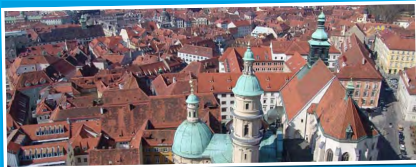
Die Grazer Altstadt.