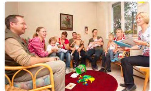
... und Eltern zum Erfahrungsaustausch.