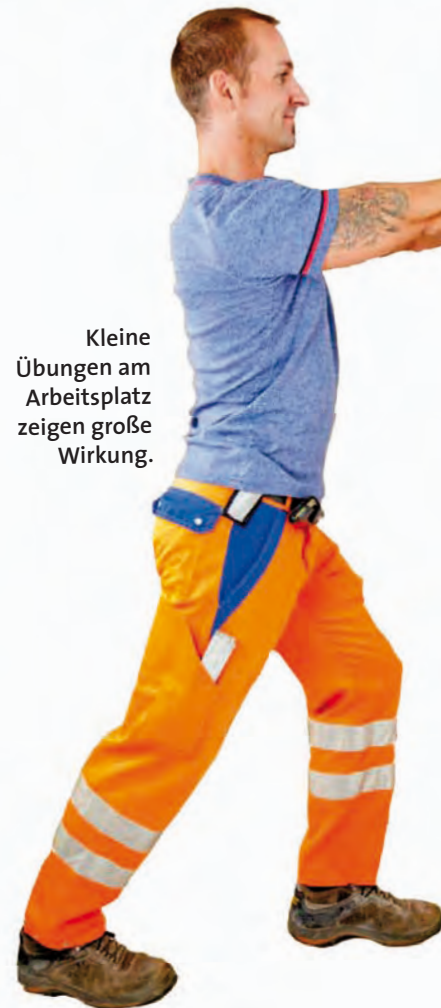
Kleine Übungen am Arbeitsplatz zeigen große Wirkung.