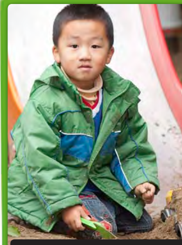
Skeptischer Blick? Nur zu Beginn. Bald wird's lustig.