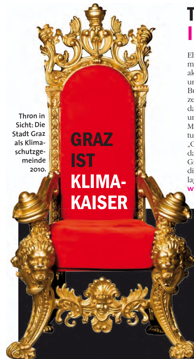
Thron in Sicht: Die Stadt Graz als Klimaschutzgemeinde 2010.

Schon wieder ein voller Erfolg für Graz! Das „Solardachkataster“-Projekt der Stadt (BIG berichtete darüber) nahm erfolgreich am Wettbewerb „Klimaschutz-Gemeinde 2010“ teil. Und nun das Beste: In der Kategorie „Gemeinde, größer als 5.000 EinwohnerInnen“ schaffte es Graz unter die ersten Drei! Wo genau am Stockerl die Stadt stehen wird, erfahren ihre RepräsentantInnen am Dienstag, 18. Oktober 2010, im Rahmen einer Gala im Wiener Konzerthaus. Also, Daumen drücken! Wir berichten in unserer nächsten Ausgabe am 13. November.