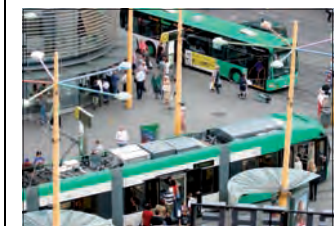
Die Verbund Linie informiert über die Öffis in Graz. FRANKL