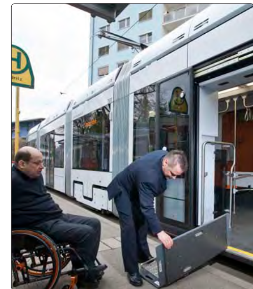
Einstieghilfen für die neue Variobahn.