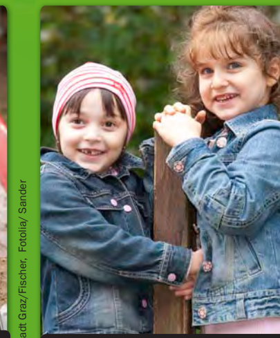
Wir verstehen uns. Kinder kennen keine kulturellen Grenzen.