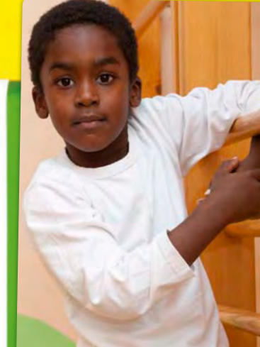
Voller Energie. Jedes Kind bringt etwas von sich ein.