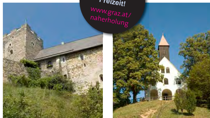
Burgruine Gösting (li.) und Kirche St. Johann und Paul am Buchkogel.