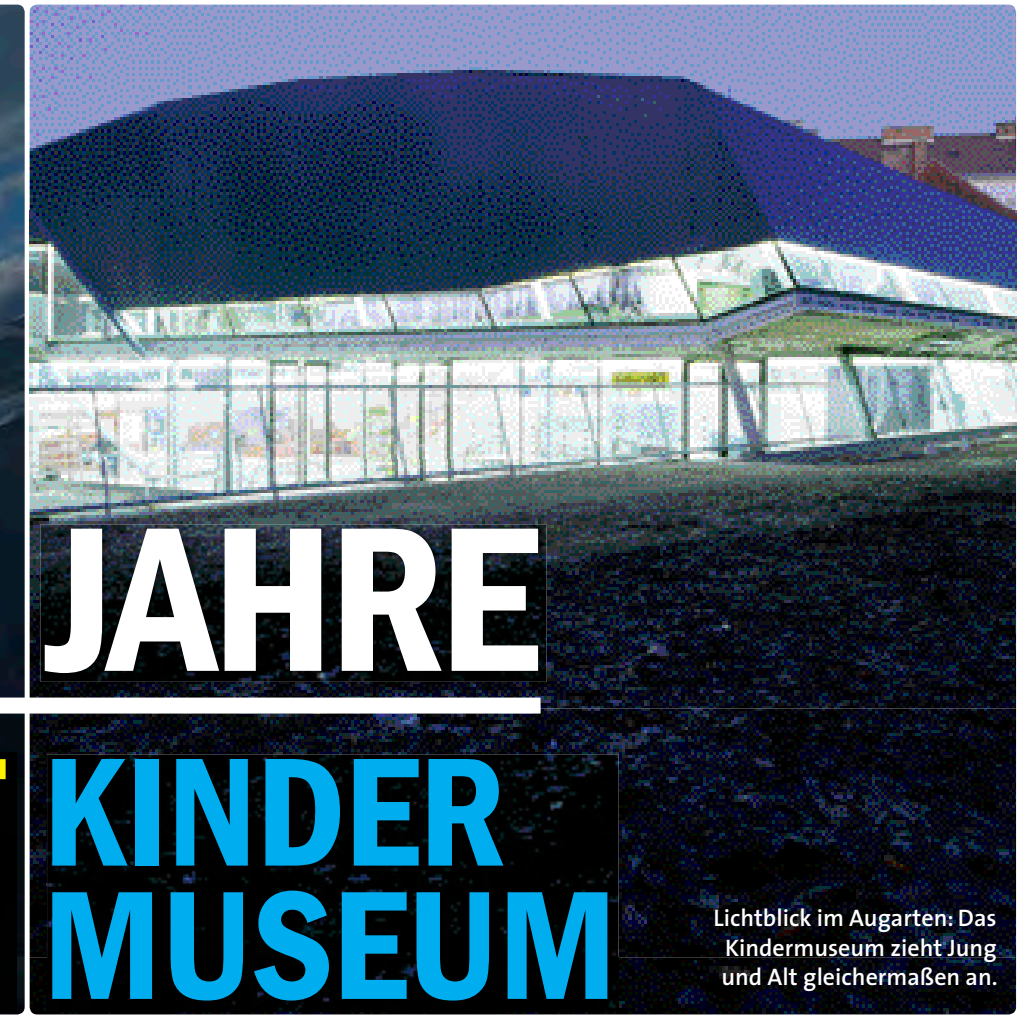
Lichtblick im Augarten: Das Kindermuseum zieht Jung und Alt gleichermaßen an.