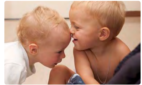
Hier treffen sich Kinder zum Spielen ...

„Nein, keinesfalls! Wir machen nur Diagnostik im Vorfeld und schauen uns das Kind in Hinblick auf seine Entwicklung, seine Gesundheit und Pflege an. Doch wenn das Baby krank oder auffällig ist, muss es unbedingt zum Kinderarzt. Wir machen nur im Ausnahmefall Mutter-Kind-Pass-Untersuchungen. In den Beratungsstellen wird nicht geimpft, sehr wohl aber schauen wir, ob das Kind gesund ist, damit es dann im Gesundheitsamt geimpft werden kann.“ ■