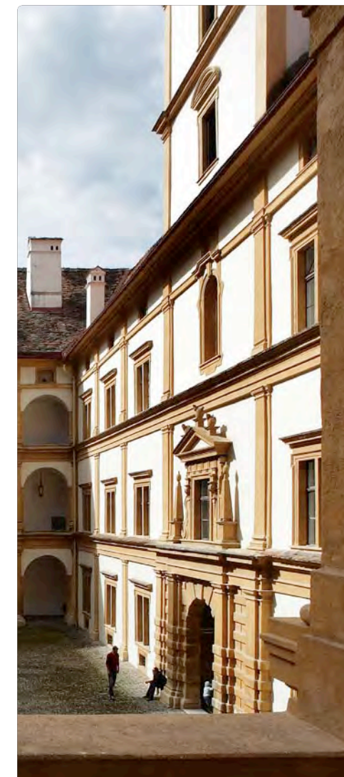
Schmuckstück. Das Schloss im Westen von Graz lädt zum Entdecken ein.