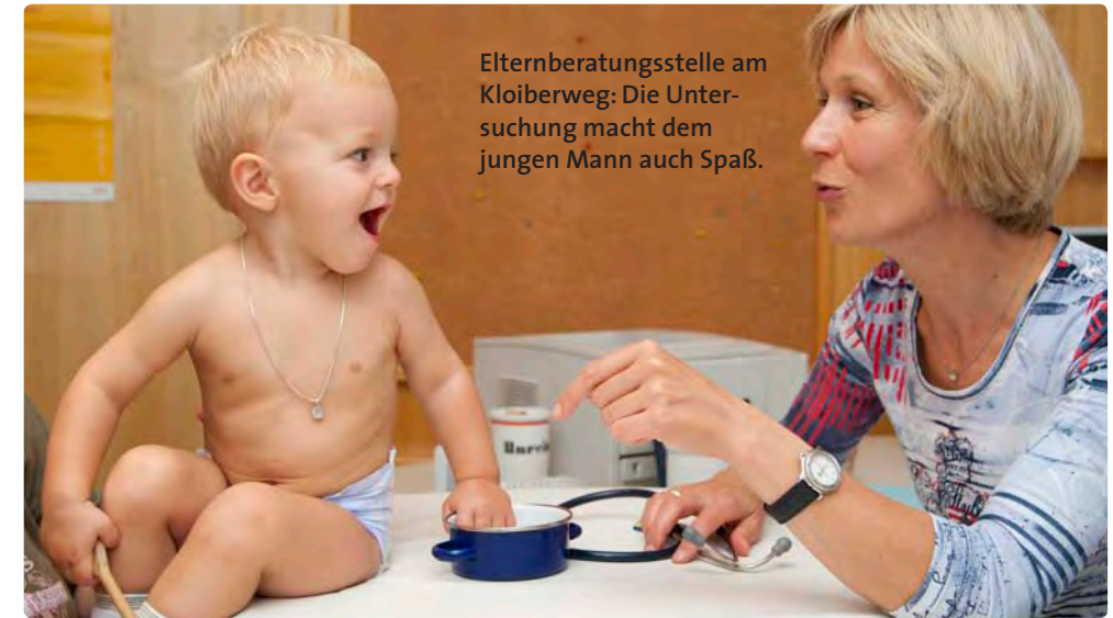
Elternberatungsstelle am Kloiberweg: Die Untersuchung macht dem jungen Mann auch Spaß.

„Wir sind eine Anlaufstelle für Eltern, die sicher gehen wollen, dass ihr Kind sich gut entwickelt. Bei uns wird das