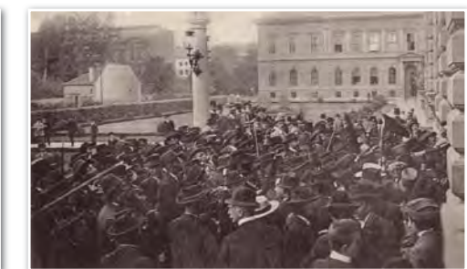
Politischer Konflikt 1908 („Bauernsturm“) an der Uni als Teil des zeitgenössischen „Kulturkampfes“.

Die medizinisch-chirurgische Ausbildung ab 1786 führte 1863 zur Eingliederung in die Universität als Medizinische Fakultät. 2004 erfolgte wiederum die Trennung. Seither gibt es eine Medizinische Universität, die sich organisatorisch und räumlich weitgehend von der Universität getrennt hat. Der neue Campus im Stiftingtal und das Landeskrankenhaus sind Schwerpunkte der medizinischen Ausbildung für rund 4.300 Studenten. 1815 wurde der „Akademische Musikverein“ (nun „Musikverein für Steiermark“) gegründet. Im Jahr darauf gab es eine vereinseigene Singschule. Aus dieser Tradition entstand aus immer mehr Fachbereichen musikalischer Ausbildung das Landeskonservatorium. Dieses wiederum erhielt 1963 den Rang einer Akademie für Musik und darstellende Kunst und 1970 den Rang einer Hochschule, 2002 jenen einer Universität (KUG = Kunstuniversität Graz). Hier werden nun fast 2.000 Studierende ausgebildet. Räumlicher Mittelpunkt der KUG ist seit 1976 das Palais Meran in der Leonhardstraße. Ein anderer Standort ist die ehemalige Reiterkaserne, ebenfalls in der Leonhardstraße. 2009 eröffnete in der Lichtenfelsgasse ein eigenes Theater mit dem Namenskürzel MUMUTH. Am Beginn der Technischen Universität stand die Joanneumsgründung 1811 durch Erzherzog Johann. Im ursprünglichen Konzept sollten Lehre, Forschung und museale Sammlung verbunden sein. Die