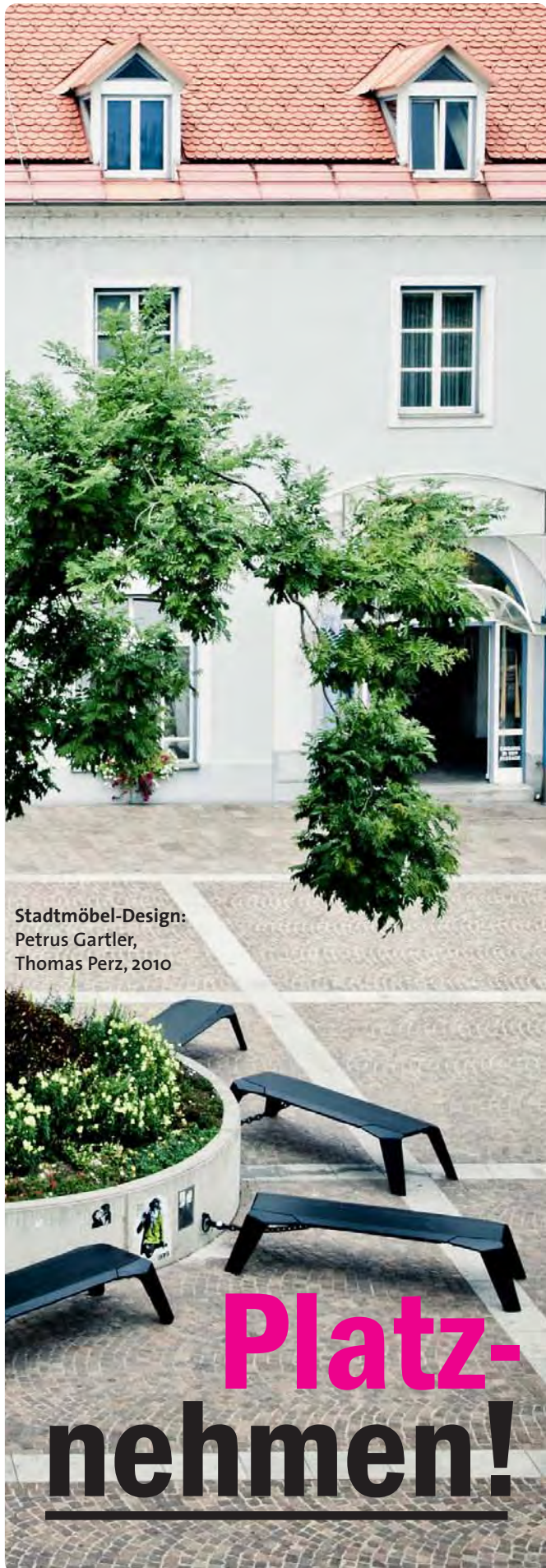
Stadtmöbel-Design: Petrus Gartler, Thomas Perz, 2010