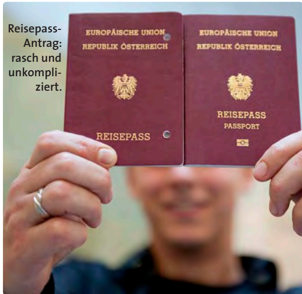
Reisepass-Antrag: rasch und unkompliziert.