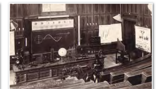
1930: Ein Blick in den Hörsaal des „Physikalischen Institutes“ der Universität Graz.

Im November erscheint das erste BIG „Historisches aus Graz“-Buch Seite 21.