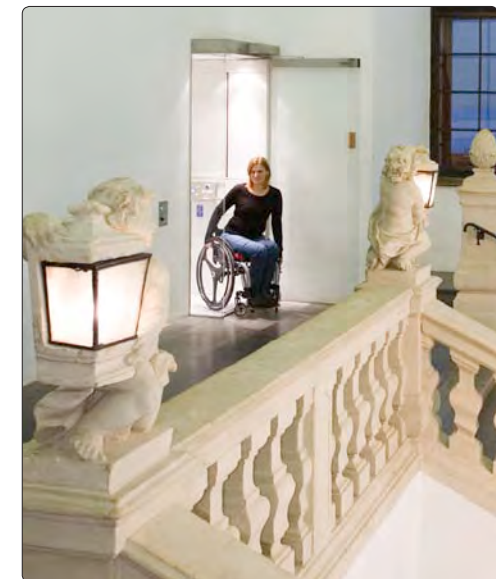
Ein Lift als Zugang zum Minoritensaal.