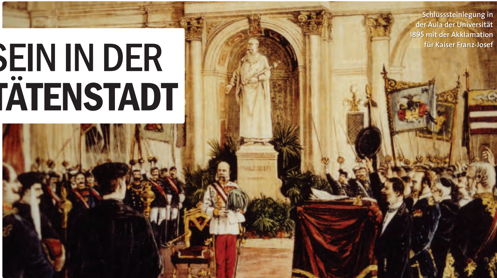
Schlusssteinlegung in der Aula der Universität 1895 mit der Akklamation für Kaiser Franz-Josef

Das Besondere an Universitäten liegt in der Verbindung von Forschung und Lehre. Irgendwie hat sich auch die Verwaltung eingeschlichen. Universitäten sind aber auch trotz aller Qualitätsmerkmale und Titel nur Schulen, eben Hochschulen. Ist der Beitrag über Graz in einem Lexikon auch noch so kurz - dass Graz Universitäten hat, wird immer erwähnt.