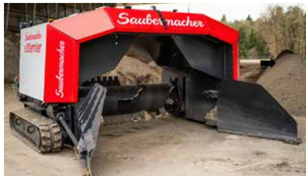
Recycling von Strahlsandrückständen