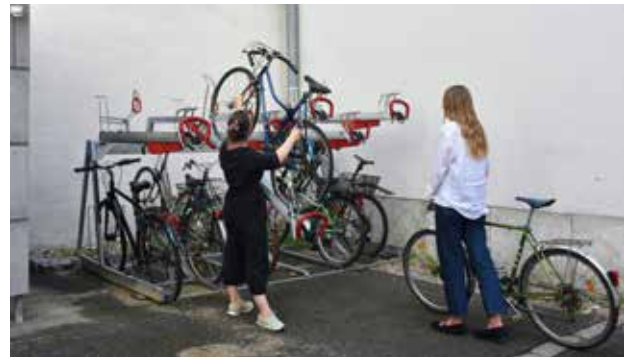
Neue Fahrradabstellplätze im Innenhof