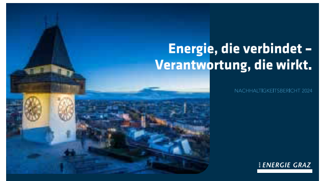
Der Nachhaltigkeitsbericht der Energie Graz