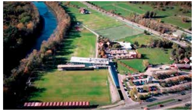
Trainingszentrum Weinzödl