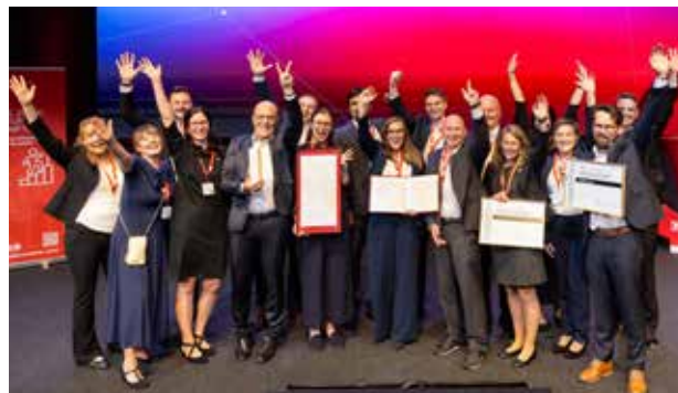
Stolze Gewinner:innen beim Staatspreis Unternehmensqualität 2025