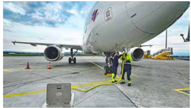
Bodenstrom neu