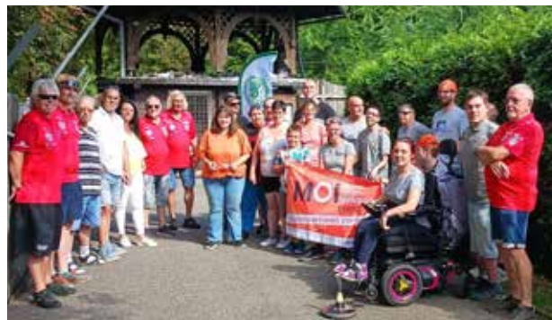
Inklusion Paulustor