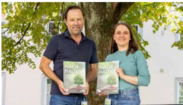
Präsentation des ersten Nachhaltigkeitsberichts der GGZ