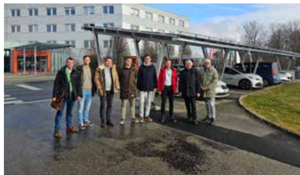
Solarcarport-Anlage bei Magna Powertrain