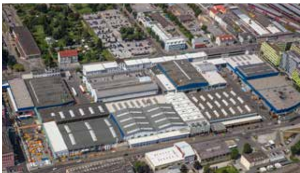
Siemens Mobility West Graz