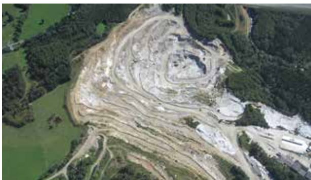
Standort Rabenwald