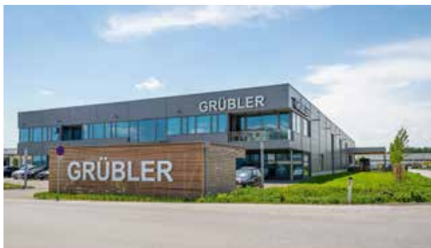
Firmenstandort