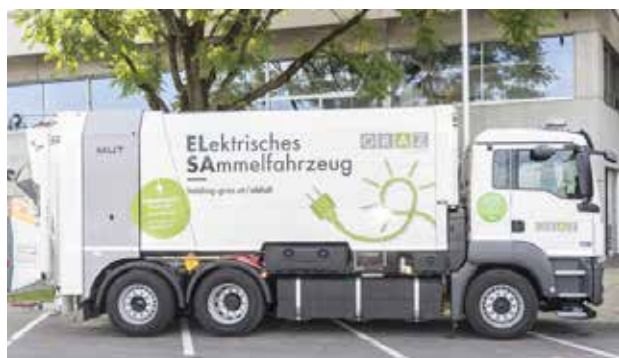
Elektisches Sammelfahrzeug