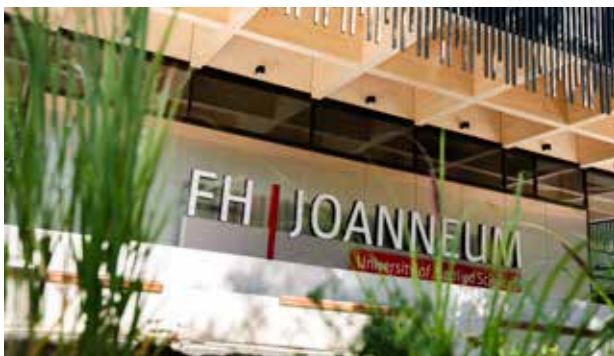
Gesundheitscampus Kapfenberg

Alte Poststraße 147, 149, 150, 152, 154; Eggenberger Allee 9, 11, 13; Eckertstraße 30i, 07a, 07b; 8020 Graz www.fh-joanneum.at ÖKOPROFIT-Ansprechpartnerin: DI in Astrid Panhofer Tel.: +43 316 5453-8139 E-Mail: astrid.panhofer@fh-joanneum.at