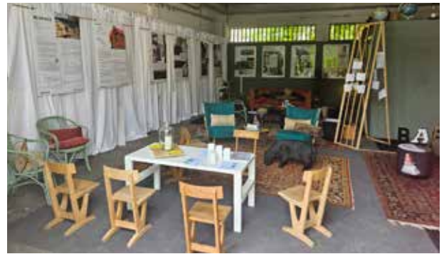
Re:Space Ausstellung im Hornig Areal.