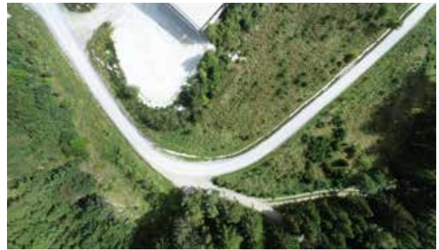
Klimafitter Wald