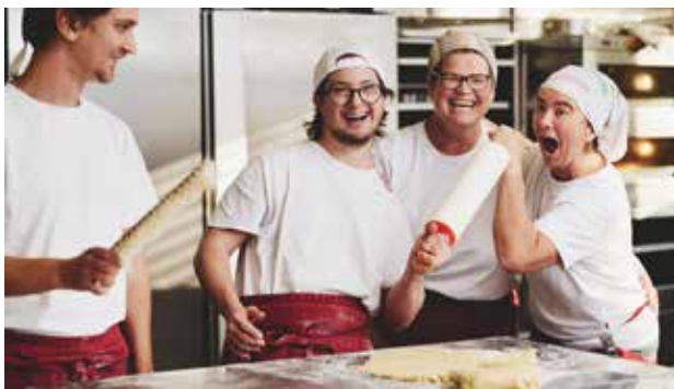
Teilnehmer:innen und Vortragende der inklusiven Klimaschutzakademie

LebensGroß Zentrale Conrad-von-Hötzendorf-Straße 37a, 8010 Graz Tel.: +43 316 71 55 06 E-Mail: office@lebensgross.at www.lebensgross.at ÖKOPROFIT-Ansprechpartner: Alfred Harnik-Singer Tel.: +43 676 84 71 55 310 E-Mail: alfred.harnik-singer@lebensgross.at