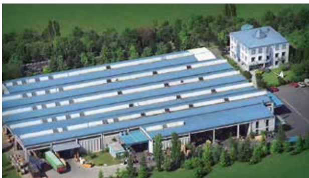
Firmsitz Graz-Puntigam