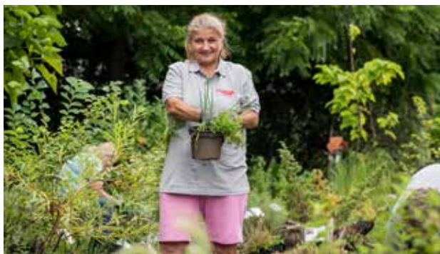
Der Klimaschutzgarten in Gosdorf bei Mureck ist gleichzeitig ein gemeinnütziges Beschäftigungsprojekt.