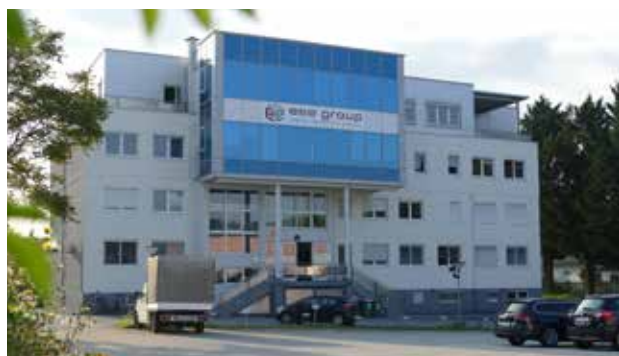
Firmensitz