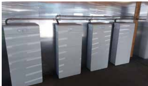
Erweiterung der PV-Anlage /Speicheranlage 150 kWh