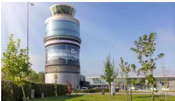
Graz Airport

E-Mail: georg.schlagbauer@graz-airport.at