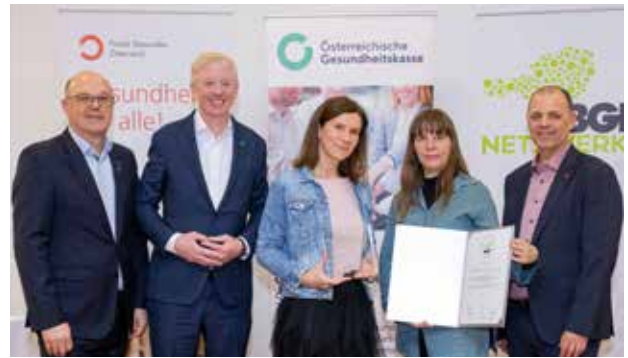
BGF Auszeichnung