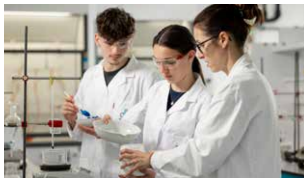
Wir bieten praxisorientierte Labor-Ausbildungen an unserem neuen Standort an

Die Chemie Akademie ist eine Institution für Aus-, Fort-, und Weiterbildung in allen Bereichen der Chemie. Sie vereint drei Sparten unter ihrem Dach. Zum einen das Kolleg für Chemie mit einer zweijährigen Vollzeitausbildung, zum anderen die Werkmeisterschule als zweijährige berufs begleitende Qualifizierung und als dritte Sparte die Kurs- und Lehrgangsangebote der Fort- und Weiterbildung.