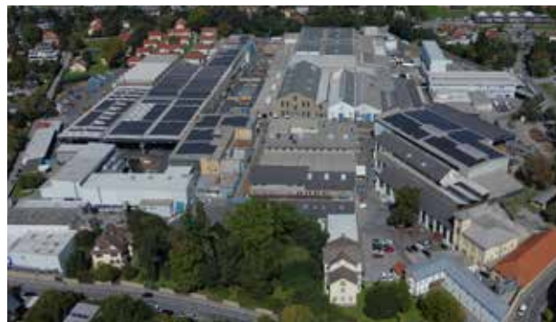
2. Teil der PV-Anlage mit 1.080 kWp