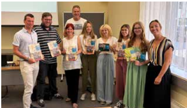
AG für Lehrlinge der Kammer für Arbeiter und Angestellte

Vortragende: Dipl.-Päd. in Cosima Pilz, Umwelt-Bildungs-Zentrum Steiermark