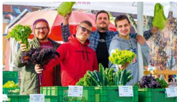
Marktstand der ökologischen Landwirtschaft Attendorf