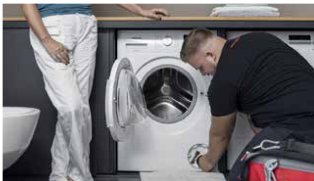
Technikereinsatz