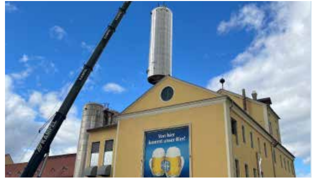
Einbringung des neuen Energiespeichers über eine Öffnung am Dach