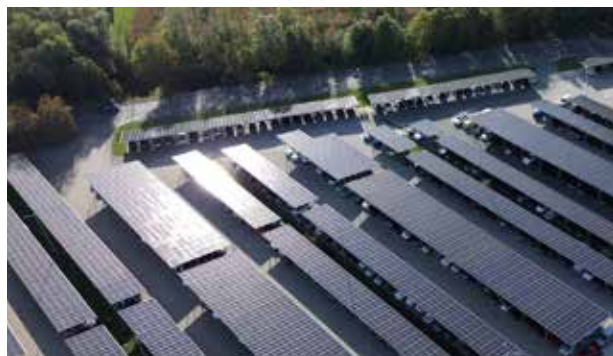
Solarcarport-Anlage bei Magna Powertrain Lannach