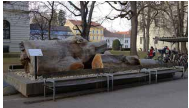
Totholzbaum vor Universitätsplatz 2