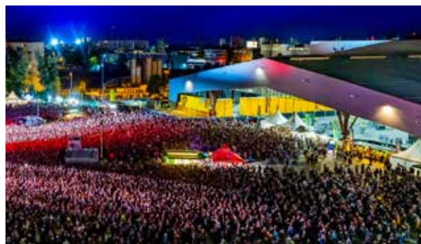
Messe Graz Open Air - Die Ärzte