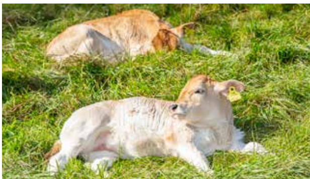
Nachwuchs am Lustbühel