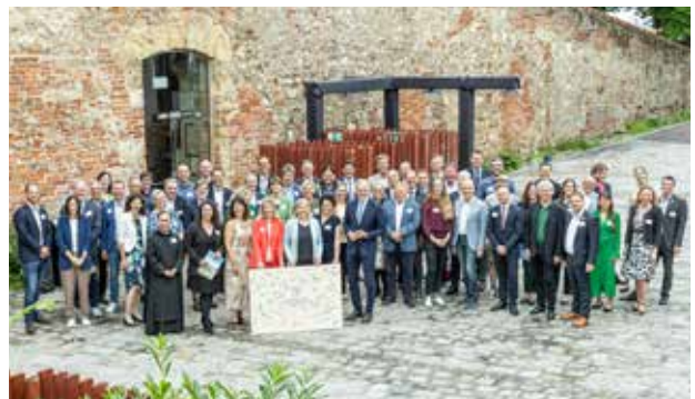
Unterzeichnung des Klimapakts 2024

Machen auch Sie mit und erhalten Sie Infos zu allen Angeboten der Stadt Graz unter: digitaleformulare.graz.at