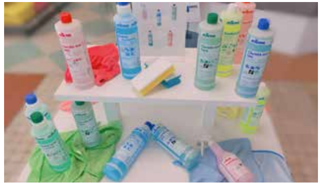
Schwerpunkt ökologisch zertifizierte Reinigungsmittel