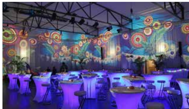
Seifenfabrik Markthalle