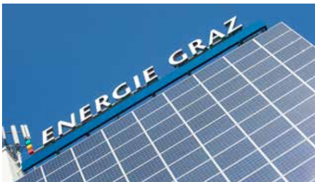
Energie Graz