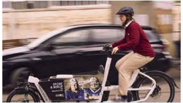
Klimaprojekt der Stadt Graz