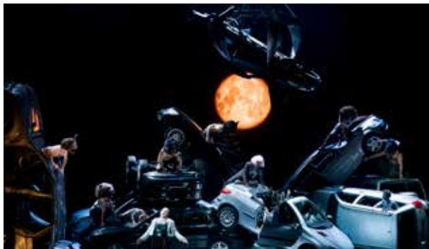
Szenenfoto A Midsummer Night's Dream Oper Graz

art+event | Theaterservice Graz gehört in Österreich zu den führenden Anbietern für Bühnenbilder, Dekorationen, Kostüme sowie individuelle Bauten für Theater, Museen, Events oder Messen.