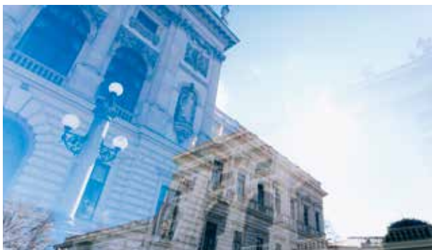
Uni Graz